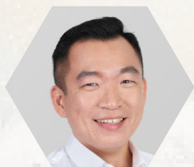
特别嘉宾 蔡瑞隆 高级政务次长